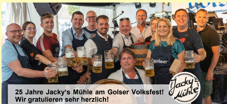
25 Jahre Jacky's Mühle am Golser Volksfest! Wir gratulieren sehr herzlich!